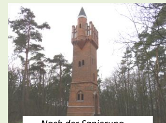
Nach der Sanierung

dazu begann die Suche nach Sponsoren und Finanzierungsmöglichkeiten. Die Hochwasserkatastrophen 2013 sollten die in Aussicht gestellten Förderungen noch einmal verzögern. 2014 konnte die bauliche Instandsetzung mit Hilfe von EU-Mitteln ( Leader Programm ), einer Lotto-Toto-Förderung, der Sparkasse Altmark West, der „Stiftung Zukunft Altmark“, vielen gesammelten persönlichen Spenden und mit der Unterstützung durch die Stadt und den Altmarkkreis beginnen. Für die Bauausführungen zeigten sich die Firmen Behnert Bau ( Lindstedt ), Planungsring Altmark GbR, Metallbau Willi Schneider (beide Salzwedel ) und Naturstein