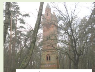
Vor der Sanierung

2010 befand sich der Salzwedeler Bismarckturm in einem bedauerlichen Zustand. Der im Jahr 2011 gegründete